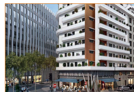
Résidence Le Cap