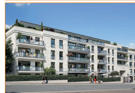
Résidence Villa Eugenia