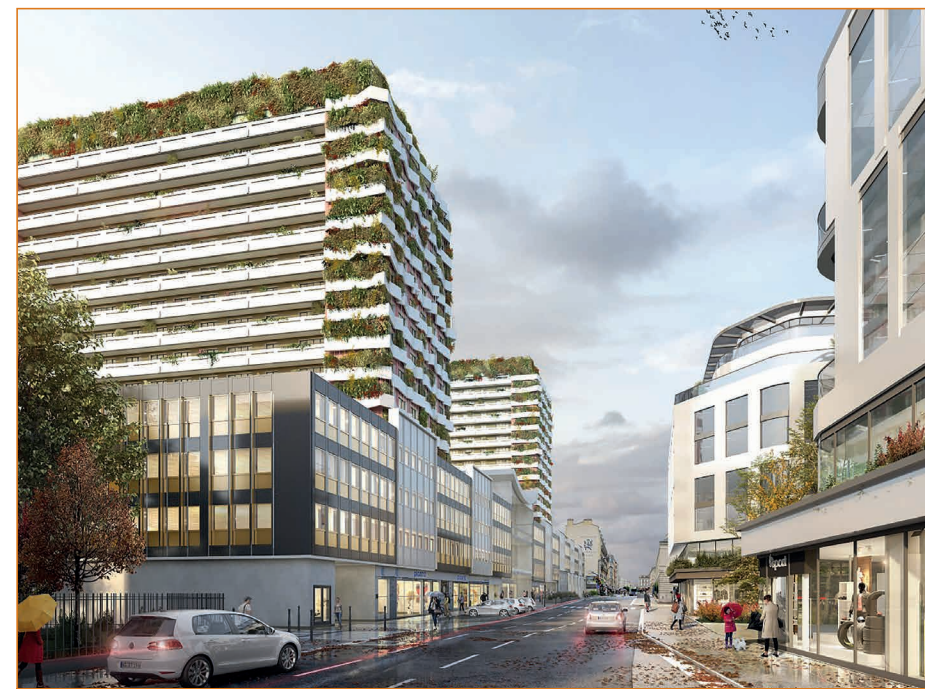
Résidence ILN Mairie

L'opération ambitieuse, menée par SOHP, de réhabilitation des immeubles ILN Mairie qui répond parfaitement à la rénovation du Cœur de Ville d'Issy-les-Moulineaux est en cours. Ce projet prévoit notamment l'amélioration de la performance énergétique des bâtiments, la réhabilitation des pièces humides des logements et des parties communes, ainsi que la végétalisation des façades pignon jusqu'au sommet des résidences. La création d'une boucle géothermique assurera non seulement l'alimentation en chaleur, mais aussi le rafraîchissement des appartements. L'installation de ce système est l'une des premières pour un ensemble immobilier aussi important et dans le cadre d'une réhabilitation en site occupé. Grâce à une large concertation avec les locataires, SOHP a su définir un projet répondant à leurs attentes et faire évoluer ce programme ambitieux en fonction de leurs remarques.