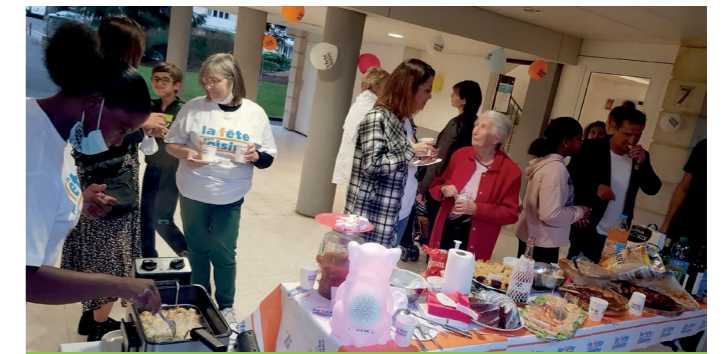
Résidence Les Sablons