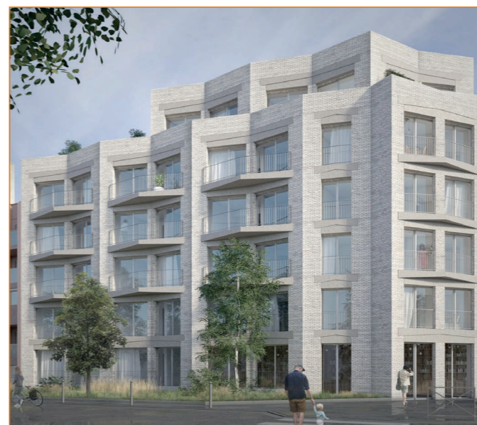
182 rue Gallieni

La ville de Boulogne-Billancourt a subventionné cette opération à hauteur de 2 200 000 €.