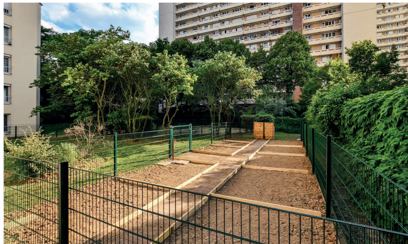
Résidence Bois Vert