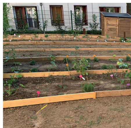
Jardin partagé Severine

L'Office espère pouvoir étendre son offre dans les mois à venir dans les résidences éligibles à la réalisation de ce type d'espaces verts.