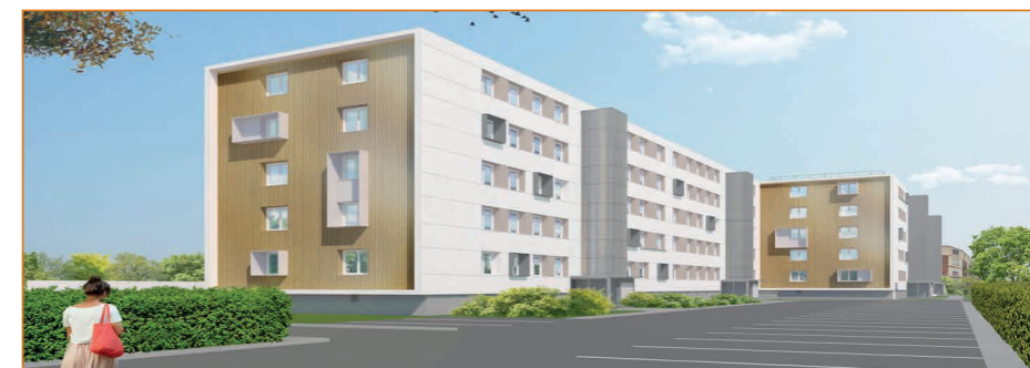
Résidence Ferdinand Buisson

Les travaux de réhabilitation, réalisés en lien avec la Ville, ont démarré rue Marcel Sembat pour cette résidence de 80 logements. Ils comprennent la reprise complète de l'enveloppe du bâtiment et la réfection des parties communes avec la création d'un ascenseur par hall. Le cout total des travaux s'élève à 4 198 918 € HT.